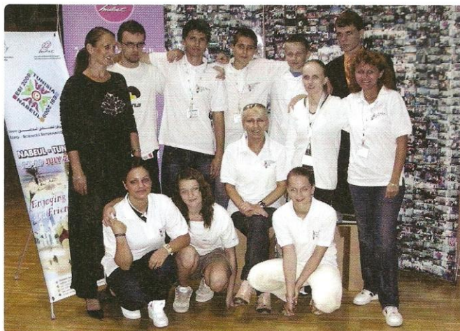
Slovenská delegácia, spoločná fotografia v stánku Milset

Organizátori ESE 2008 Budapešť sa zhostili svojej úlohy s elánom. Menší počet účastníkov – 261 so 101 projektmi zo 17 štátov Európy (plus 3 mimoeurópske krajiny: Juhoafrická republika, Mexiko a Taiwan) – radí tohtoročné ESE medzi tie menšie. Program bol však bohatý. Dopoludnia sa už tradične venovali vedeckému a kultúrnemu programu a popoludní samotnej prezentácii projektov. Z vedeckého programu