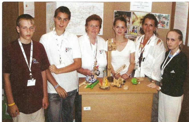
Delegácia Vedeckej hračky v ich stánku

Výstava ESE je nesúťažnou výstavou, preto sme si my ani ostatné delegácie ceny neod-